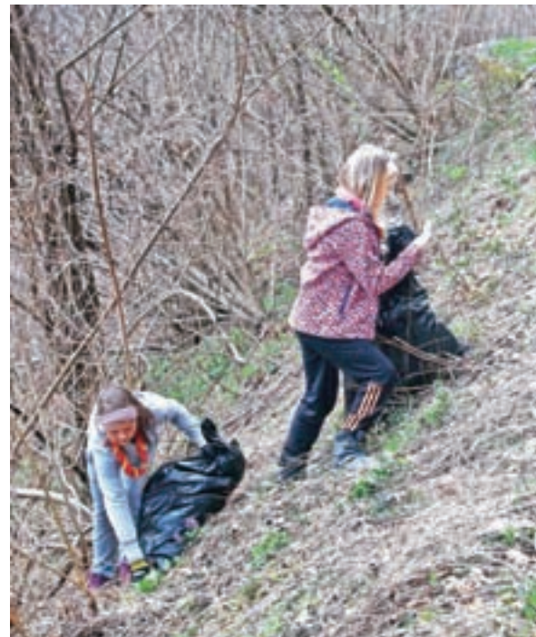
V Železnikih so se akciji pridružili tudi taborniki.

šestdeset, od tega veliko otrok. Čistilna akcija je po besedah Jelenčeve povežala celo vas oz. združila KS ter športno, gasilsko in kulturno-turistično društvo. Ženske in otroci so po vasi pobirali odpadke, moški pa so pometli ceste in odstranili pesek, ki je ostal od zimske