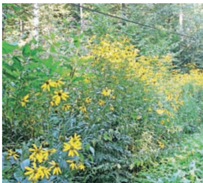
Deljenolistna rudbekija lahko izpodrine vse domorodne vrste z gozdnega roba.

tuljnika in mnogolistnega volčjega boba ("zajčkov"). Odstranjevanje invazivk je zahtevno že z vrta, iz narave, kjer se veliko bolj razrastejo, pa še veliko bolj, zato je vedno na prvem mestu preventiva. Če se zgodi, da je vrsto treba odstraniti z vrta ali narave, pa velja splošno pravilo, da se odstranjuje pred cvetenjem, da ne širimo semen, in s koreninami vred, saj imajo številne v koreninah, gomoljih ali korenih zaloge hranil, ki jim omogočijo ponovno rast. Ostanke je najbolj varno posušiti in sežgati.