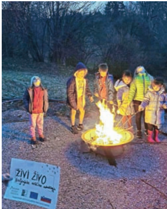
Utrinek z delavnice Pravljичno ognjišče

Izvajamo tudi delavnice za otroke in mladino, in sicer Pravljичno ognjišče s pripovedovanjem pravljic ob ognjišču, rokodelstvom, preprostimi praktičnimi znanji, spoznavamo različne pedagoške teme, npr. o pomenu proste igre, zakaj je dolgčas pomemben itd. Delavnice izvajamo tudi za mladino. Digitalna kompetenca je digitalna abstinenca (poklicna orientacija, rokodelstvo, opazovanje sveta, razvoj idej ...). Za izvedbo smo že v dogovoru z Javnim zavodom Ratitovec.